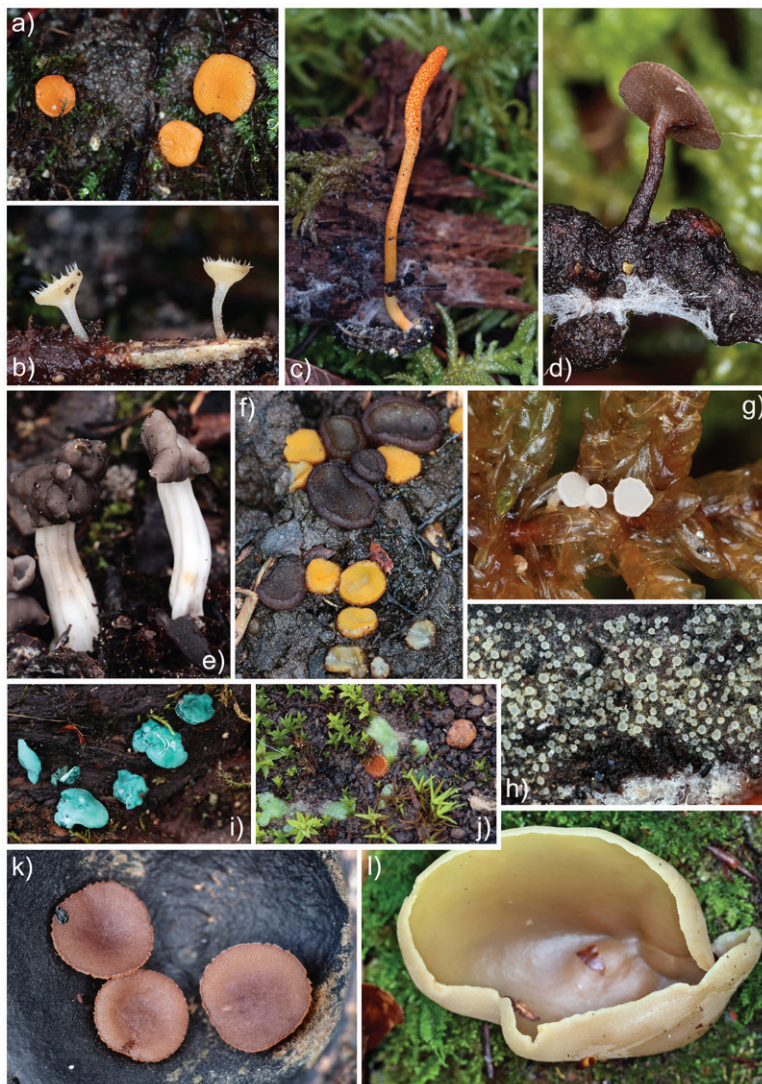
Slika 6. Neke vrste gljiva zabilježene za vrijeme četvrtog terenskog istraživanja u oktobru 2019. godine: a) Pulvinula convexella , potok Skočigrm; b) Cyathicula coronata , Klobučki potok – Aranđelovo; c) Cordyceps militaris , parazit na larvi insekta, potok Skočigrm; d) Rutstroemia firma , grančica drijena ( Cornus mas ); e) Helvella sulcata , Klobučki potok; f) Ascobolus carbonarius i Anthracobia melaloma , zgarište na Bijeloj gori; g) Bryoscyphus rhytidadelphus , parazit na mahovini Pseudoscleropodium purum ; h) Arachnopeziza obtusipila , na deblu crnog bora ( Pinus nigra ); i) Chlorociboria aeruginascens , na odumrlom panju bukve; j) Lamprospora miniata , parazit na mahovini (Bijela gora); k) Rutstroemia echinophila , na kupulama žira (put prema Bijeloj gori); k) Peziza arvernensis , na odumrlom panju bukve obraslom u mahovinu (Bijela gora) / Figure 6. Some fungal species recorded during the fourth field research in October 2019: a) Pulvinula convexella , Skočigrm stream; b) Cyathicula coronata , Klobučki stream - Aranđelovo; c) Cordyceps militaris , parasite on insect larva, Skočigrm stream; d) Rutstroemia firma , cornelian cherry twig ( Cornus mas ); e) Helvella sulcata , Klobučki stream; f) Ascobolus carbonarius and Anthracobia melaloma , burned ground close to the Bijela gora plateau; g) Bryoscyphus rhytidadelphus , parasite on moss Pseudoscleropodium purum ; h) Arachnopeziza obtusipila , on dead trunk of Pinus nigra ; i) Chlorociboria aeruginascens , on rotten beech stump; j) Lamprospora miniata , parasite on moss (Bijela gora); k) Rutstroemia echinophila , on acorn cups (road to the Bijela gora plateau); k) Peziza arvernensis , on rotten beech stump covered in moss (Bijela gora)