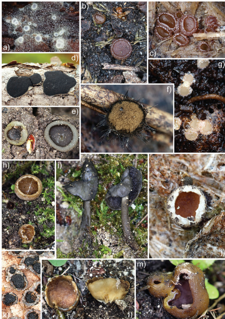
Slika 4. Neke od vrsta zabilježenih tokom inventarizacije gljiva na teritoriji Parka prirode „Orjen”: a) Arachnopeziza aurata , bukova šuma na Bijeloj gori; b) Ascobolus carbonarius , Skočigrm; c) Ascobolus furfuraceus , fimikolna vrsta na kravljem izmetu na pašnjaku kod izvora Skočigrm; d) Biscogniauxia nummularia , otpale bukove grane (Bijela gora); e) Peziza succosella , riparijska šuma uz rijeku Sušicu kod Arandelova; f) Desmazierella acicola , prvi potok na putu prema Bijeloj gori; g) Lasiobelonium belanense , na Prunus sp., izvor Skočigrm; h) Tarzetta cupularis , u koritu polupresušenog potoka (izvor Skočigrm); i) Helvella atra , Stapovi (Sušica); j) Pseudombrophila ripensis , na kravljem izmetu (izvor Skočigrm); k) Diatrype disciformis , s bukovih grančica, Bijela gora; l) Helvella acetabulum , selo Vučija; m) Peziza michelii , (Sušica, Stapovi) / Figure 4. Some of the ascomycetous fungal species recorded during the inventory in the territory of the „Orjen” Nature park: a) Arachnopeziza aurata , beech forest on the Bijela gora plateau; b) Ascobolus carbonarius , Skočigrm spring; c) Ascobolus furfuraceus , fimicolous species on cow dung, steep pasture near Skočigrm spring; d) Biscogniauxia nummularia , on dead fallen beech branches (Bijela gora); e) Peziza succosella , riparian forest and shrubs close to the Sušica riverbank near the village Arandelovo; f) Desmazierella acicola , first stream on the way to Bijela gora; g) Lasiobelonium belanense , on Prunus sp., Skočigrm spring; h) Tarzetta cupularis , in semi-dried streambed (Skočigrm spring); i) Helvella atra , Stapovi (Sušica river); j) Pseudombrophila ripensis , on cow dung (Skočigrm spring); k) Diatrype disciformis , on dead fallen beech twigs, Bijela gora; l) Helvella acetabulum , village Vučija; m) Peziza michelii , (Sušica river, Stapovi)