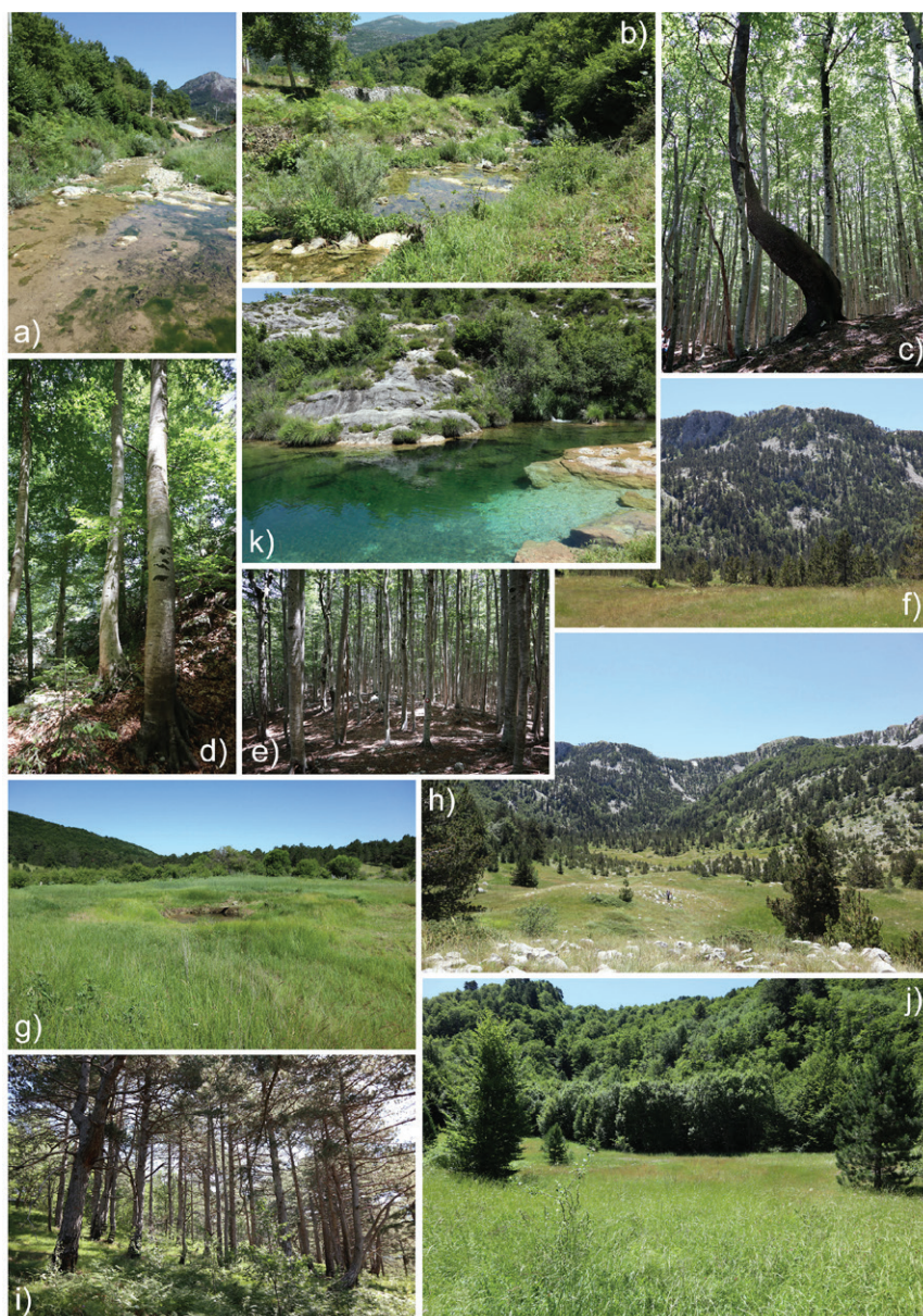
Slika 3. Detalji s trećeg terenskog istraživanja u junu 2019. godine: a), b) riparijska staništa sa inundacijskim zonama i vrbicama (potok Jazine); c) prva uočena munika ( Pinus heldreichii ) u sastojini bukve na potezu od Ubala prema Studencima; d), e) subalpske bukove šume na putu prema Studencima; f), h) okolina lokaliteta Studenci, sastojine munike (1400 mnv); g) bare na Ublima sa higrofilnom vegetacijom; i) šuma crnog bora na Ublima u blizini planinarskog doma; j) jedan od manjih suhих planinskih travnjaka na putu prema Studencima; k) rijeka Sušica, Stapovi / Figure 3. Some of the details from the third field research in 2019: a), b) riparian habitats with willows in the inundation zones (Jazine stream); c) the first spotted Bosnian pine tree ( Pinus heldreichii ) in a beech forest on the way to Studenci, Mt. Orjen; d), e) subalpine beech forest on the way to Studenci; f), h) area around locality Studenci, Bosnian pine forest (1400 m asl); g) locality with seasonal pools and hygrophilous vegetation (Ubli, Mt. Orjen); i) black pine forest, near the mountain hut (Ubli, Mt. Orjen); j) small dry mountain grassland on the way to Studenci; k) Sušica river, Stapovi