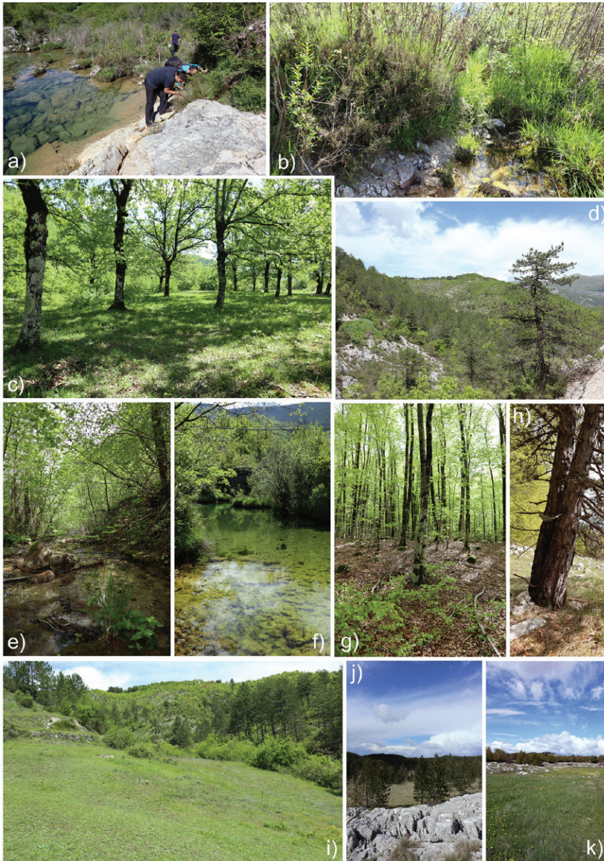
Slika 2. Detalji s drugog terenskog istraživanja u maju 2019. godine: a), b) inundacijske zone rijeke Sušice (Stapovi); c) šuma cera ( Q. cerris ) u blizini sela Vučija na granici sa Crnom Gorom; d) padine Orjena na putu prema Bijeloj gori; e) potok i cjedište na putu prema Bijeloj gori; f) gornji tok rijeke Sušice (okolina sela Vučija); g) bukova šuma na platou Bijele gore; h) detalj iz eudominatnih sastojina Pinus nigra , Bijela gora; i) pašnjaci kao veoma značajno stanište za fimikolne i saprotrofne vrste gljiva (Skočigrm); j), k) predjeli i staništa na platou Bijele gore, planina Orjen / Figure 2. Some of the details from the second field research in 2019: a), b) inundation zones of the Sušica river (Stapovi); c) Turkey oak ( Q. cerris ) forest in the vicinity of the village Vučija nearby border with Montenegro; d) slopes of the Mt. Orjen on the way to Bijela gora plateau; e) small stream and natural water drainage on the way to Bijela gora; f) the upper course of the Sušica river (vicinity of the village Vučija); g) beech forest on the Bijela gora plateau; h) detail from the eudominant stands of Pinus nigra , Bijela gora; i) pastures and meadows as a very important habitat for diverse fimicolous and saprotrophic fungal species (Skočigrm); j), k) scenery and habitats on the Bijela gora plateau, Mt. Orjen