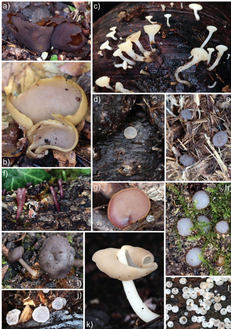
Slika 7. Neke vrste gljiva zabilježene za vrijeme četvrtog terenskog istraživanja u oktobru 2019. godine: a) Otidea bufonia , na rubu šume ispod javora, bora i hrasta (put prema Bijeloj gori); b) Otidea alutacea , prilično česta vrsta u bukovim šumama na Bijeloj gori; c) Hymenoscyphus fructigenus , na žiru ( Quercus sp.); d) Thecotheus holmskjoldii , na izmetu ovce, Klobučki potok; e) Thecotheus keithii , na izmetu konja, Bijela gora; f) vrsta iz roda Ascocoryne (anamorf), potok Skočigrm; g) Peziza michelii , Arandelovo, aluvijalna šuma s pješčanim tlom oko rijeke Sušice; h) Trichophaea woolhopeia , Klobučki potok; i) Helvella branzeiana , prva inundacijska zona Klobučkog potoka; j) Thecotheus pelletieri , na izmetu krave, Arandelovo (livade); k) Helvella elastica , zgarište oko Klobučkog potoka; l) Lasiosphaeria ovina , grana bjelogorice, potok Skočigrm / Figure 7. Some fungal species recorded during the fourth field research in October 2019: a) Otidea bufonia , on the edge of the forest under maple, pine and oak (road to the Bijela gora plateau); b) Otidea alutacea , quite common species within beech stands on the Bijela gora; c) Hymenoscyphus fructigenus , on acorn ( Quercus sp.); d) Thecotheus holmskjoldii , on sheep dung, Klobučki stream; e) Thecotheus keithii , on horse dung, Bijela gora; f) Ascocoryne species (anamorph stage), Skočigrm stream; g) Peziza michelii , Arandelovo, alluvial forest with sandy soil on the Sušica riverbanks; h) Trichophaea woolhopeia , Klobučki stream; i) Helvella branzeiana , Klobučki stream, first inundation zone; j) Thecotheus pelletieri , on cow dung, Arandelovo (pastures); k) Helvella elastica , burned ground, Klobučki stream; l) Lasiosphaeria ovina , branch of deciduous tree, Skočigrm stream