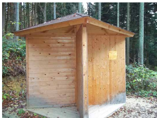
Slika 5. Nadstrešnice kao primjer elemenata od drveta (2011. god.) / Figure 5. Canopies es example of wooden construction elements (2011)