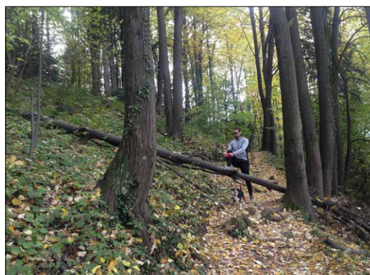
Slika 7. Rekreacija na prostoru šuma Starčevica (2016. god.) / Figure 7. Recreation in the area of Starčevica forest (2016)

Sve ovo navedeno je model donošenja odluka i planova koji takođe treba da je dio savremenog planiranja i upravljanja u šumarstvu i samim tim prilika da naše šumarstvo (JPŠ) napravi korak u tom pravcu. U ovom procesu ni jedna od strana ne smije da zaboravi da se radi o interesu cijele zajednice i da se mora primarno ispoštovati hijerarhija u važnosti funkcija – odnosno odrediti primarnu važnost konkretnog objekta. Smatramo da je za grad Banjaluku važno da primarna namjena ovih šuma bude zaštitna i odmah potom veliki naglasak stavljamo na socijalne funkcije, prevashodno odmor i rekreacija (što ne isključuje udio i drugih funkcija, ali u značajnije manjem udjelu od prioritarnih) (Slika 7).