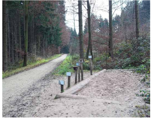
Slika 3. Prostor za skok u dalj sa mjerama izraženim preko dužina skokova šumskih životinja (2011. god) / Figure 3. Space for long jump with measures expressed over the length of the jumps forest animals (2011)

Šumarska praksa koja bi svoju realizaciju u budućnosti gradila na ovakvim i sličnim primjerima (Matić & Prpić, 1997), a na prostoru najnaseljenijeg grada RS bi mogla donijeti korist kako za korisnike tako i za šumarstvo, jer bi time pomjerali paradigmu od one o šumarima kao 'inženjerima za sječu šume', ka nadamo se istinitijoj o šumarima 'kao čuvarima i zaštitnicima šumskih ekosistema'. Takođe šumarstvo bi kao društveno-odgovorna djelatnost moralo konačno na konkretnom primjeru da dokaže svoja znanja iz područja upravljanja šumskim resursima u kojima bi primarni cilj bio socijalni i/ili zaštitni – kao vrlo važan pomak i iskorak iz