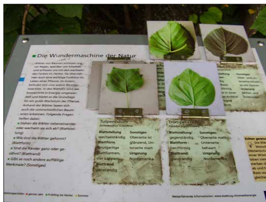
Slika 6. Edukativni sadržaj – pogađanje vrsta drveća (2009. god.) / Figure 6. Educational content - recognition tree species (2009)

Naglašavamo da mi kroz ovaj rad ne smatramo i ne očekujemo da takva vrsta zaokreta u šumarskoj politici treba da obuhvati cjelokupan prostor, naprotiv predlažemo da se to radi samo tamo gdje je očito neophodno, a s obzirom na veliku šumovitost i relativno malu urbanu izgrađenost naše zemlje jasno je da bi to bile vrlo male površine u ukupnom poslovanju – samim tim, u današnjem načinu sagledavanja predmetne problematike i procentualno mali gubici.