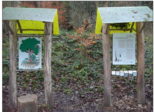
Slika 4. Edukativne table o šumskim procesima i pojavama postavljene duž rekreacione trase (2011. god.) / Figure 4. Educational panels about forest processes placed along the recreational route (2011)

isključivo proizvodnog sistema upravljanja (taj pomak je i u skladu sa savremenim šumarskim tendencijama i potrebama savremenog društva) (Fazlić et al., 2010).