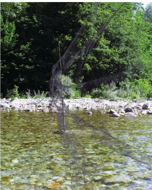
Slika 6. Ornitološke mreže na Sutjesci prilikom prstenovanja / Figure 6. Ornithological nets on Sutjeska river during the bird ringing

Pored posmatračkih i drugih korištenih metoda za faunistička istraživanja, organizovano je i markiranje (prstenovanje) ptica u cilju praćenja migracije, biologije vrsta i distribucije (Slike 6 i 7). Za potrebe prstenovanja korištene su vertikalne ornitološke mreže (Slika 6) 1016/12 proizvođača Ecotone (Poljska). Na ptice su stavljeni aluminijski prstenovi Centra za markiranje životinja iz Beograda (Srbija), sa natpisom NH MUSEUM BELGRADE i odgovarajućom oznakom veličine prstena i serijskog broja, usljed nepostojanja