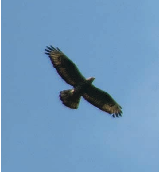
Slika 8. Osičar ( P. apivorus ) u Nacionalnom parku „Sutjeska“ / Figure 8. European Honey Buzzard ( P. apivorus ) in Sutjeska National Park