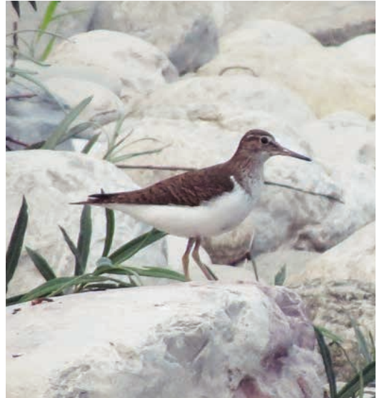
Slika 9. Polojka ( A. hypoleucos ) na rijeci Sutjesci / Figure 9. Common Sandpiper ( A. hypoleucos ) on the Sutjeska river

Istraživano područje predstavlja mozaik različitih „mikrostaništa“ koja omogućavaju prisustvo i gniježđenje različitih specifičnih vrsta, čak i onih netipičnih za (visoko)planinska područja, na što su ukazali i Rucner & Obratil (1973). Zanimljiv je nalaz teritorijalne prepelice ( Coturnix coturnix ) u okolini Orlovačkog jezera, jedinom mjestu na širem području nacionalnog parka gdje je vrsta bila nađena i početkom 1970-ih (Rucner & Obratil, 1973). Uočene su i druge sličnosti, kao i razlike u odnosu na ranije istraživanje. Dalja proučavanja su svakako neophodna kako bi se dodatno rasvijetlio status i rasprostranjenje pojedinih rijetko bilježenih vrsta, a posebno onih koje se bilježene samo tokom ranijih istraživanja.