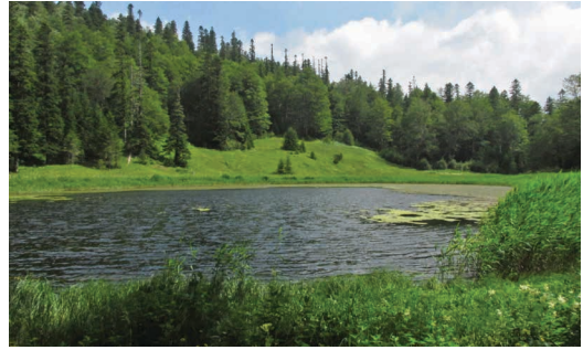
Slika 5. Crno jezero / Figure 5. Crno jezero lake