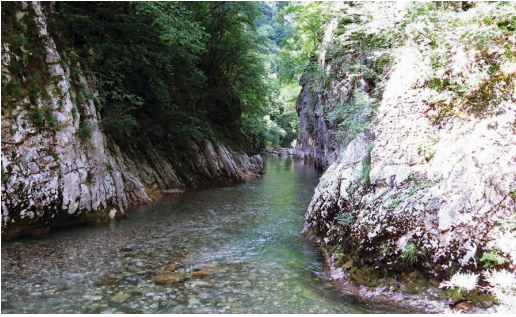
Slika 4. Rijeka Sutjeska u kanjonu / Figure 4. Sutjeska river in the canyon