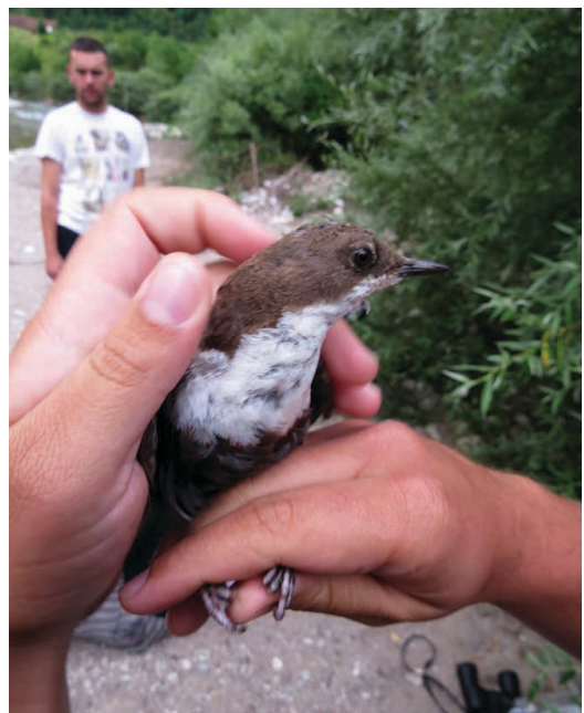
Slika 7. Izlov i prstenovanje ptica tokom istraživanja / Figure 7. Catching and bird ringing during the field study