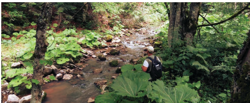
Slika 3. Istraživanje rijeke Hrčavke na području gornjeg toka, iznad ulaza u kanjon / Figure 3. Research of the upper reaches of the Hrčavka river, above the entrance to the canyon